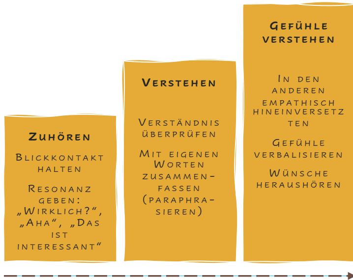
Illustration: angelehnt an Roberto Ferraro

AKTIVES ZUHÖREN MEINT HIER KEIN REIN PASSIVES VERHALTEN, SONDERN ZEICHNET SICH DADURCH AUS, DASS DER ZUHÖRER DURCH MIMIK, GESTIK, FRAGEN STELLEN UND PARAPHRASIEREN DEM ANDEREN DAS GEFÜHL GIBT, VERSTANDEN ZU WERDEN.